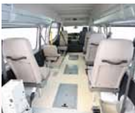
フラットでスッキリとした床面の快適な室内空間。