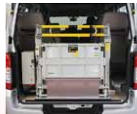
コンパクトに収納できる350kg対応の格納式折り畳みリフト。