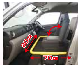
助手席部分に設置された荷物収納スペース。(80cm x 70cm)