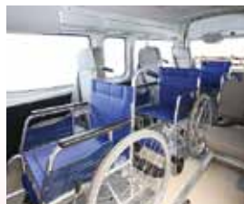
車いす3名がゆったり乗車できます。(ストレッチャー搭載可)