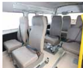
快適な座り心地のリクライニングハイバック座席及び兼用車いす。